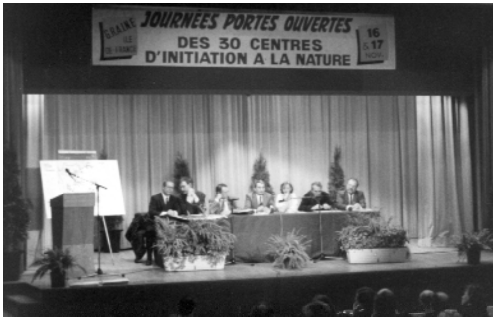
Séance inaugurale et conférence de presse du GRAINE Ile de France.