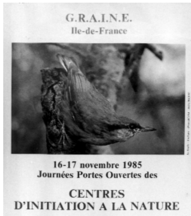
Affiche des premières portes ouvertes des structures rattachées au GRAINE Ile de France.