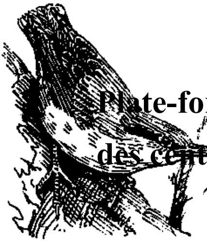
Plate-forme de coordination des centres d'Ile de France